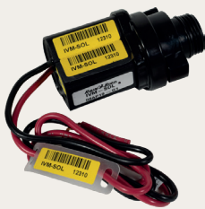
IWM-SOL 控制站点 或主阀