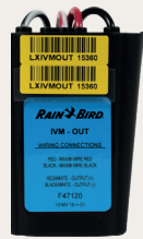
IVM-OUT 管理第三方阀 或设备