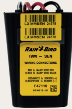
IVM-SEN 控制天气或 流量传感器